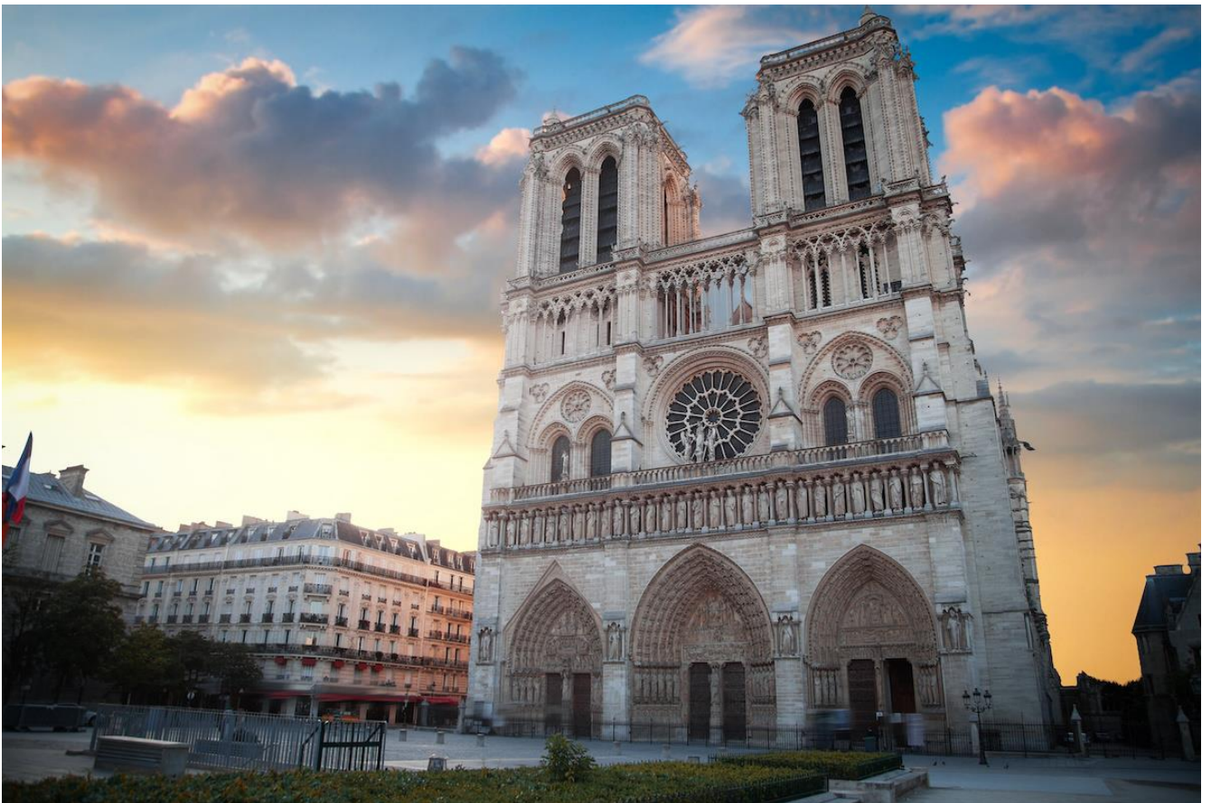
Cattedrale di Notre Dame, Parigi