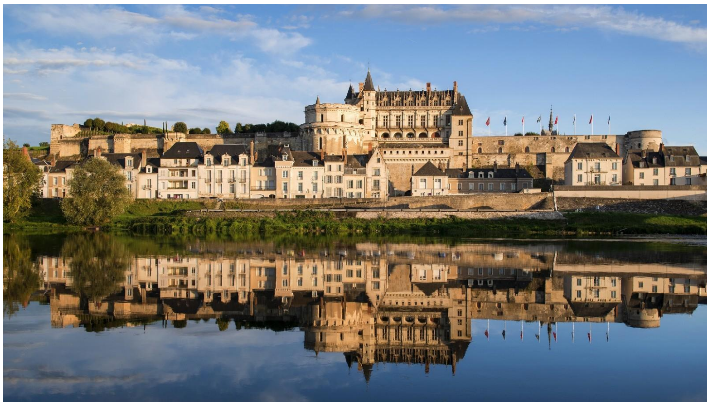
Castello di Amboise