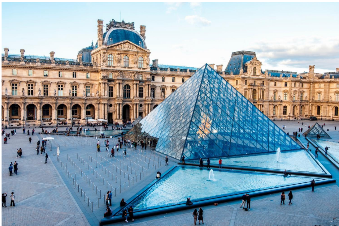
Museo del Louvre, Parigi