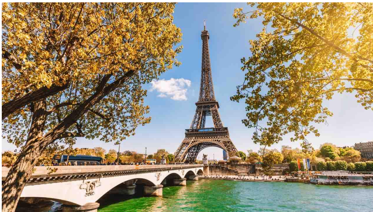
Torre Eiffel, Parigi