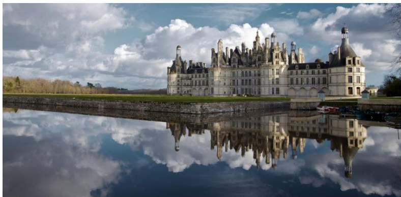
Castello di Chambord